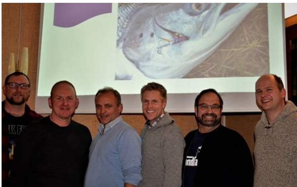
Daglig leder og styret i Numedalslågen forvaltningslag.